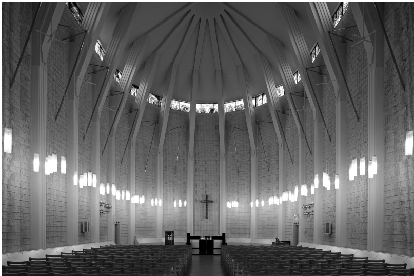
THE CHAPEL OF KOBE SHOIN WOMEN'S UNIVERSITY